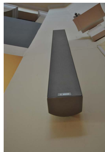
Array de sonido Varidireccional de Bosch