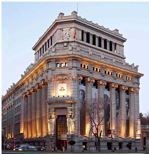
Vista exterior del Instituto Cervantes en Madrid

Estos dos sistemas de debates y megafonía dotan al Instituto en sus reuniones de una acústica perfecta y una comunicación sin interferencias que facilitan la participación e intervención de todos los asistentes.